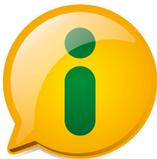
Figura 1 – Ícone de identificação da L.A.I.

O G-Transp é uma aplicação web que auxilia gestores públicos a criar, formatar e gerir, de uma forma geral, páginas com informações essenciais para divulgação do município na Internet e no atendimento da Lei de Acesso à informação.