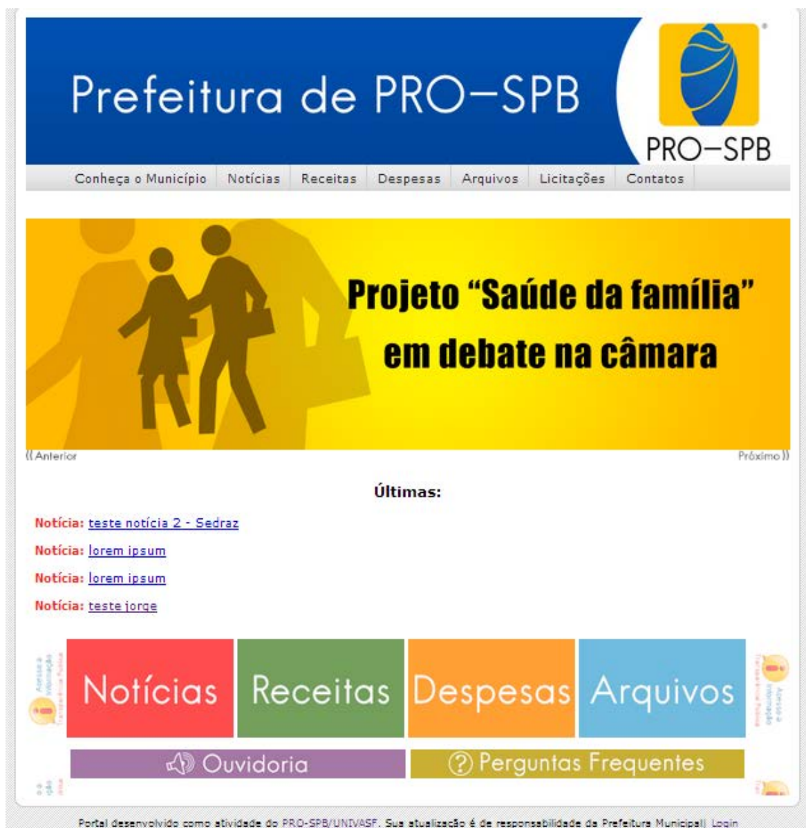
Figura 4 – Página inicial do gerenciador

No menu superior, é possível encontrar informações sobre o município, como detalhes sobre a sua história, seus pontos turísticos e sua estrutura organizacional. Também, há links para notícias, arquivos, despesas, receitas e licitações, além de um botão para entrar em contato com o atendimento especializado.