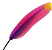
Figura 2 – Logo Apache TomCat